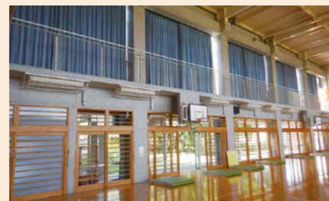
既に設置されている城ノ上小学校の屋内運動場

設置工事は避難所開設区分における優先度をベースに各学校と調整の上、決定します。工事期間は1校あたり約2か月間。