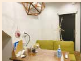
「あだち若者サポートテラスSODA」