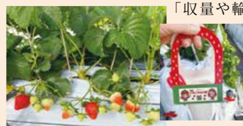
越谷いちごみらい園

事業主体は、(株)いちごみらい舎(民間事業者)。低コスト対候性ハウスや農産物処理加工施設を整備し、「あまりん」や夏秋イチゴなど数品種のいちご約66,000株(年間収量56.7t)を栽培。約30tを香港、シンガポール、タイ、オーストラリアへ輸出します。