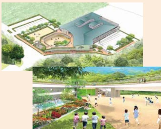
(仮) 緑の森公園保育所の完成予想図