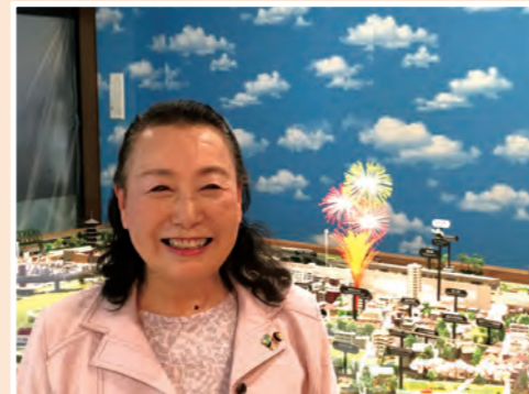
▲私も電車を動かしてみました(ジオラマの前で)

今後も議員として初心を忘れず、市政に対するさまざまなご意見やご要望に真摯に向き合い、自己研鑽に励み、期待にお応えすべく、「ふるさと越谷」の発展と市民生活のため誠心誠意努めてまいります。