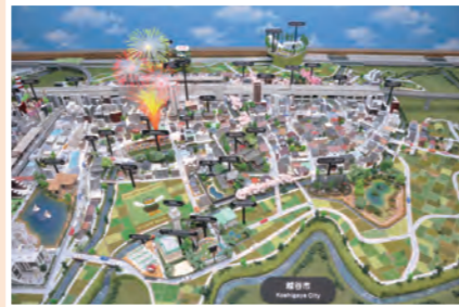
東武スカイツリーラインのジオラマ

私は越谷市の観光や情報発信の取り組みや提言等をライフワークの一つとして力を入れてまいりました。今後も越谷市のシティプロモーションに積極的に取り組んでまいります。