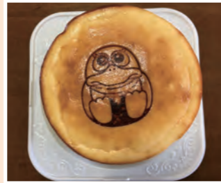
▲ガーヤちゃんチーズケーキ 私も大好きです

施設内では越谷市の物産をはじめ、東武沿線等の名産品の販売、だるまなど越谷市の伝統工芸の実演や体験もできます。また、東武スカイツリーライン沿線のジオラマがあり、実際に電車を動かして楽しめます。