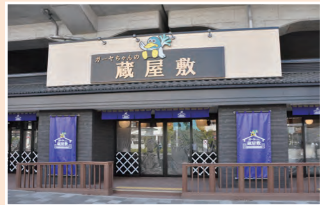
▲ガーヤちゃんの蔵屋敷