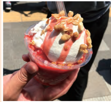
▲越谷産のイチゴを使ったスイーツ「いちご雪」この夏のおすすめ!!

この施設では、市と越谷市観光協会と連携し、日光街道の宿場町「越ヶ谷宿」の玄関口でもある越谷駅東口の賑わいを創出し、越谷市の魅力を内外に発信し、集客・送客を軸にした地方創生に取り組んでいきます。